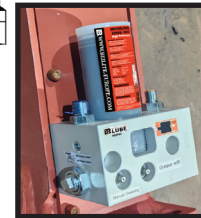
optional B@LUBE MINI